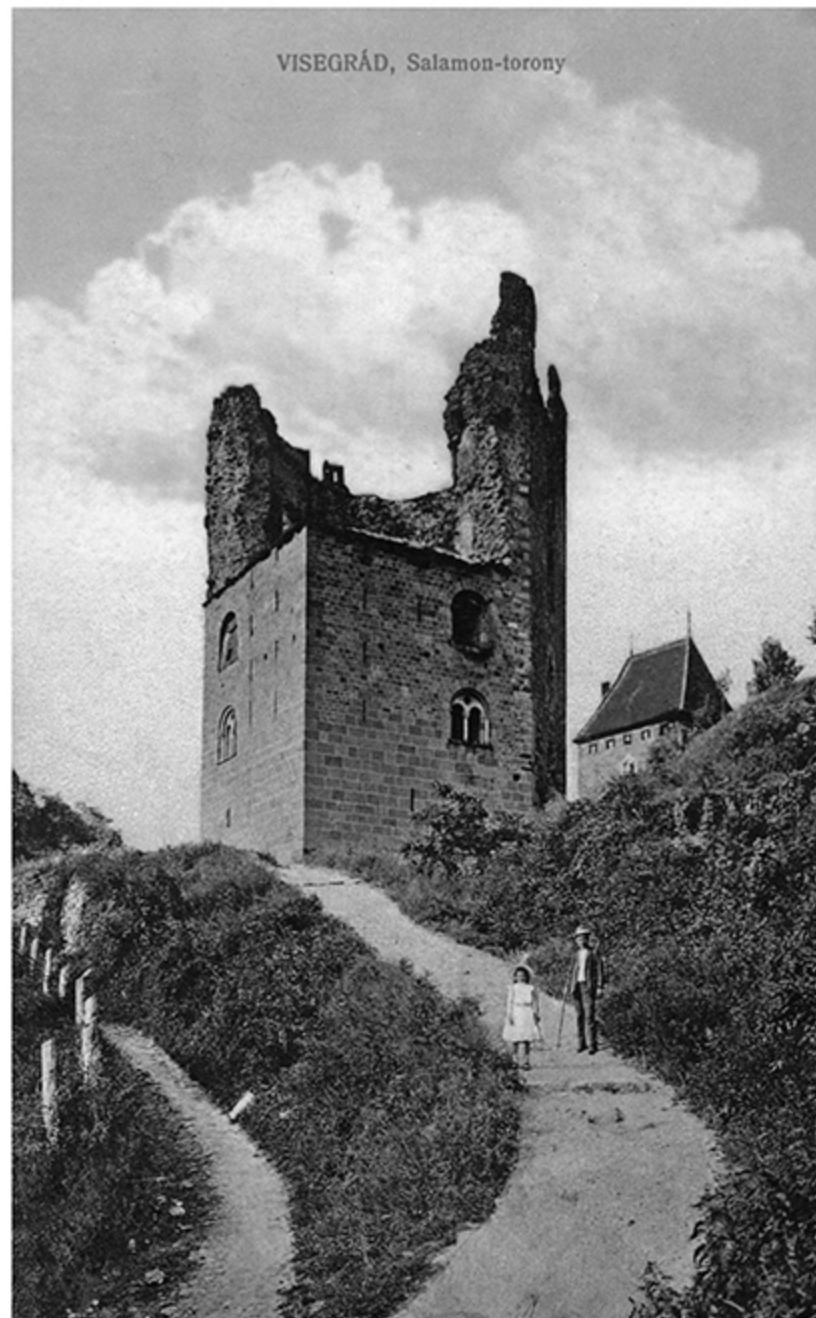
Visegrád, Turnul lui Solomon, ilustrată din 1912

ar fi rămas doar o reședință nobiliară obișnuită dacă în anii 1330 nu ar fi fost de două ori locul unor întrevederi prelungite dintre regele ungar Carol Robert de Anjou, regele Cehiei Jan de Luxemburg și monarhul polonez Cazimir al III-lea din dinastia Piast. Cei trei suverani ridicau cupele pentru prietenie veșnică, vânau, urmăreau turnirurile cavaleresti, se delectau cu peisajele fluviale, iar în timpul care le rămânea plănuiau acțiuni comune împotriva Habsburgilor, care încă nu aveau puteri depline. În plus, în 1335, Jan de Luxemburg i-a vândut lui Cazimir al III-lea, pentru suma de 20.000 de groși praghezi, drepturile de succesiune la tronul său, iar în 1339 monarhii au hotărât că în cazul în care Cazimir moare fără a avea copii, succesorul său va fi Ludovic, fiul lui Carol Robert și al Elisabetei, sora lui Cazimir. În 1370, așa s-a și întâmplat: ultimul Piast a avut cinci fiice și trei fii nelegitimi, ceea ce nu i-a permis dinastiei sale să se mențină la putere.