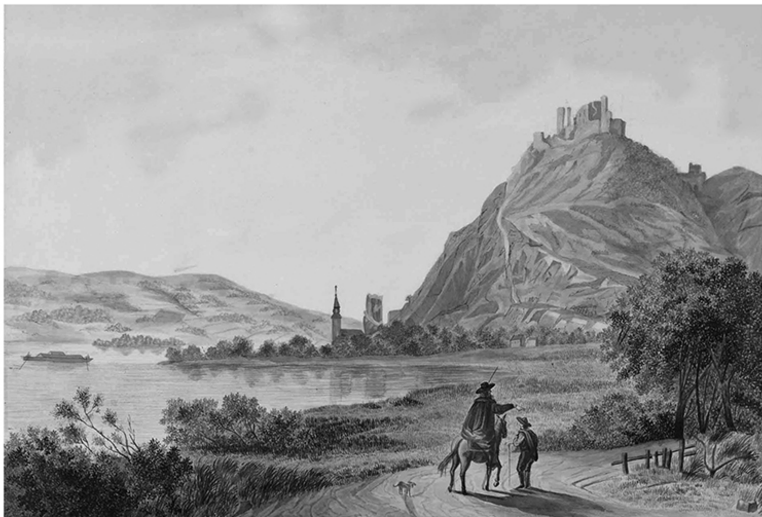
Anton Schrödl, Visegrád , 1906

istorice, cu obiectivele economice și ale turismului sportiv. Pretutindeni este vizibil faptul că acesta este locul în care Dunărea săvârșește principala sa cotitură maghiară.